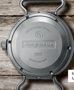
КРЫШКА МОДЕЛЬ 1967г